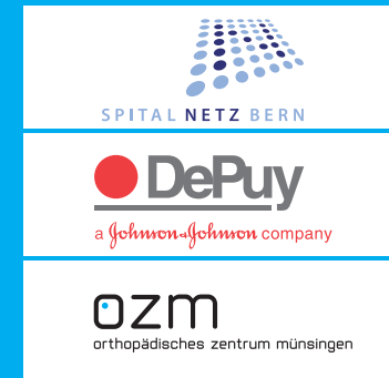
CoSponsoren und Aussteller