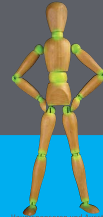
Hauptsponsoren und Aussteller